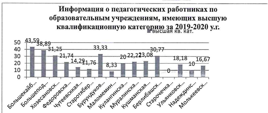
Рис. 2 Показатели высшей квалификационной категории в разрезе школ

Самые высокие показатели по наличию высшей квалификационной категории отмечаются в Большекайбицкой школе, Большеподберезинской, Бурундуковской и Хозесановской школах. В образовательных учреждениях с наименьшими показателями по высшей категории необходимо усилить выполнение методической задачи по обеспечению роста квалификации педагогических работников (рис.3,4).